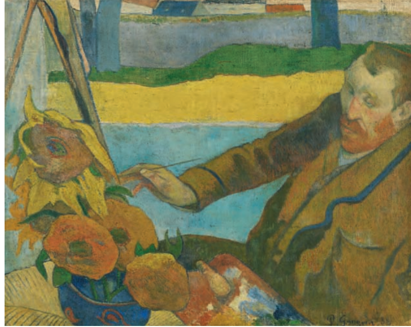
34 Paul Gauguin Vincent van Gogh zonnebloemen schilderend, 1888 Olieverf op doek, 73 × 91 cm Van Gogh Museum, Amsterdam (Vincent van Gogh Stichting)

deel uit van Van Goghs plannen voor een kring van schildervrienden om zich heen. Vóór de komst van Paul Gauguin begon hij koortsachtig zonnebloemen te schilderen met het idee er meerdere van op te hangen in het toch al felgele huis waarin hij in Arles vier kamers huurde. Naast de schilderijen wilde hij er ook vazen neerzetten gevuld met deze enorme bloemen (afb. 33). Hoe de relatie met Gauguin ook precies stukliep (Gauguins ongeduld botste met het artistieke temperament van Van Gogh), de zonnebloem-kant van de zaak schiep een band. Gauguins liefdevolle portret van Vincent als de ‘schilder van zonnebloemen’ lijkt me