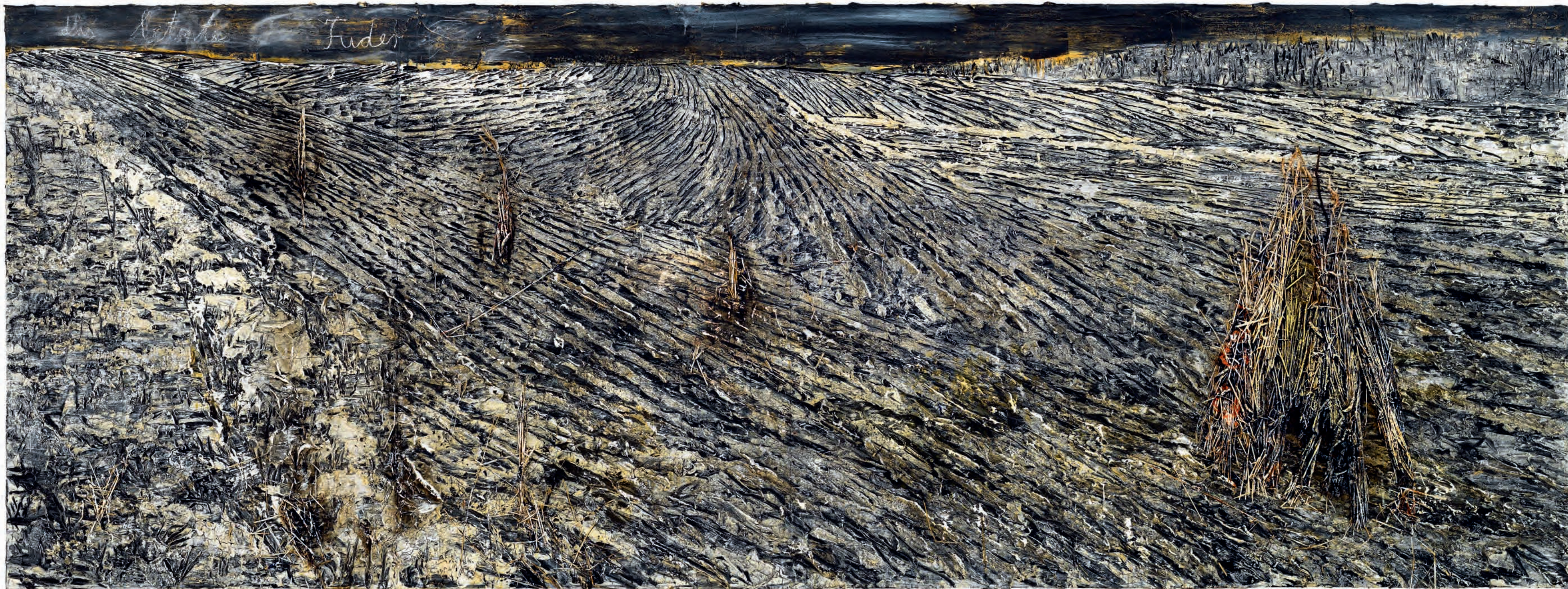
55 Anselm Kiefer Das letzte Fuder ( De laatste karrenvracht ), 2019 Emulsie, olieverf, acrylverf en stro op doek, 280 x 760 cm