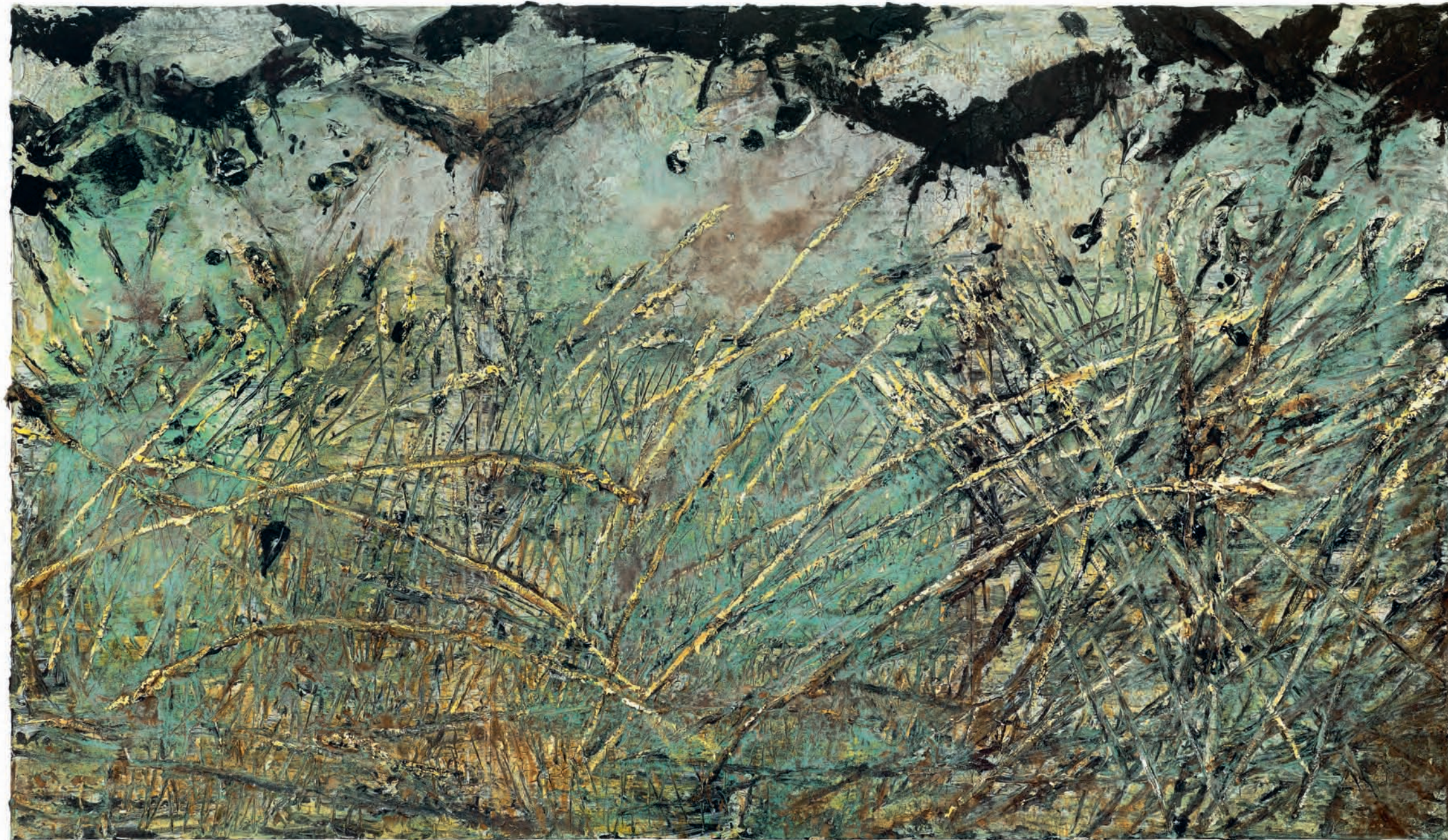
50 Anselm Kiefer Nevermore (Nooit weer) 2014 Emulsie, olieverf acrylverf, schellak, bladgoud en bezinksel van een elektrolyse op doek, 330 x 570 cm