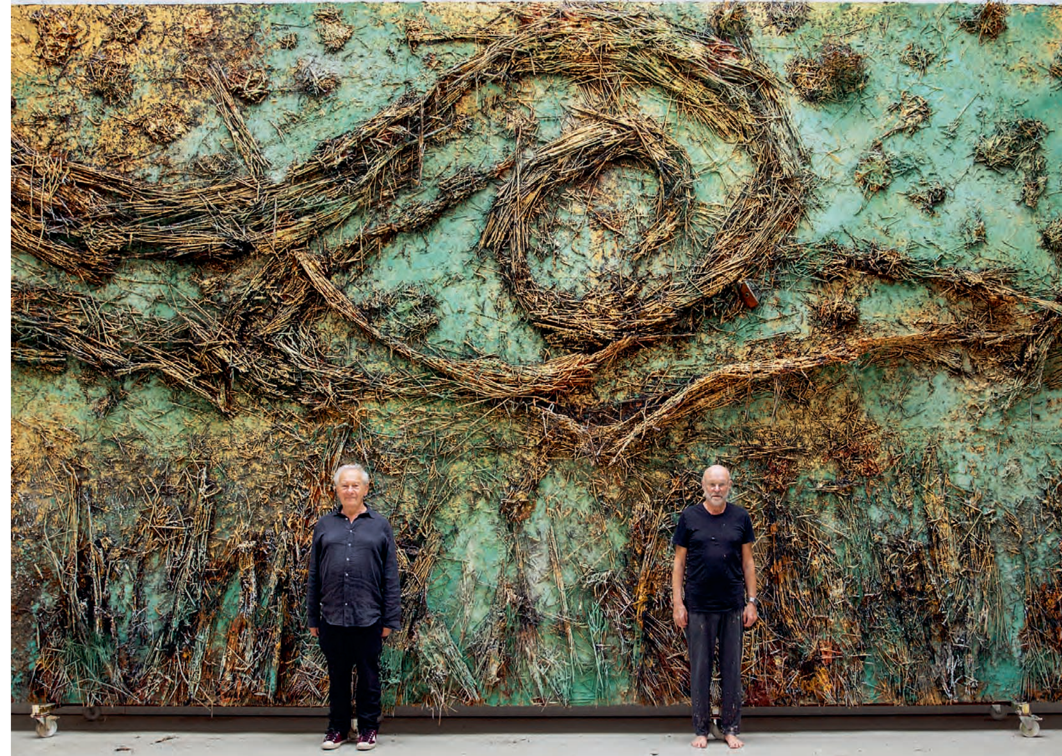
48 Simon Schama en Anselm Kiefer voor De sterrennacht , in Kiefers atelier in Croissy, juli 2024.

In Anselm Kiefers meest ambitieuze en fascinerende werken schuilen altijd diepgravende overpeinzingen over de onscheidbaarheid van leven en dood, van de aarde en de hemelkoepel, van microkosmos en macrokosmos, nieuwe wetenschap en oeroude kennis, duisterheid en openbaring. Zoals altijd werken de zintuigen en de geest samen om de maximale denkkraft aan te zuigen. Toch belemmert dit alles geenszins zijn bevlogen speelsheid. Toen ik in 2024 aan het eind van de lente met Kiefer over de oprit achter zijn atelier liep, hielden we halt op een plek waar een wolk van felgekleurde klaprozen stond te dansen in de zon naast een zonnebloem van hars en gips: levende en niet-levende bloemen die ontsproten aan een berg kapotgeslagen beton. Kiefer barstte uit in gegniffel zoals hij wel vaker doet: de lach van een magiër. Maar dat was niets vergeleken met zijn vreugdekreten toen hij zich over de scheuren in de oprit boog waardoorheen zich onkruid en mos naar het licht duwden. ‘Kijk!’, riep hij alsof we nog nooit zoiets hadden gezien en het niet zo zeer te verwachten viel als wel begroet moest worden als een nieuw mirakel. Vincent van Gogh zou dat hebben begrepen.