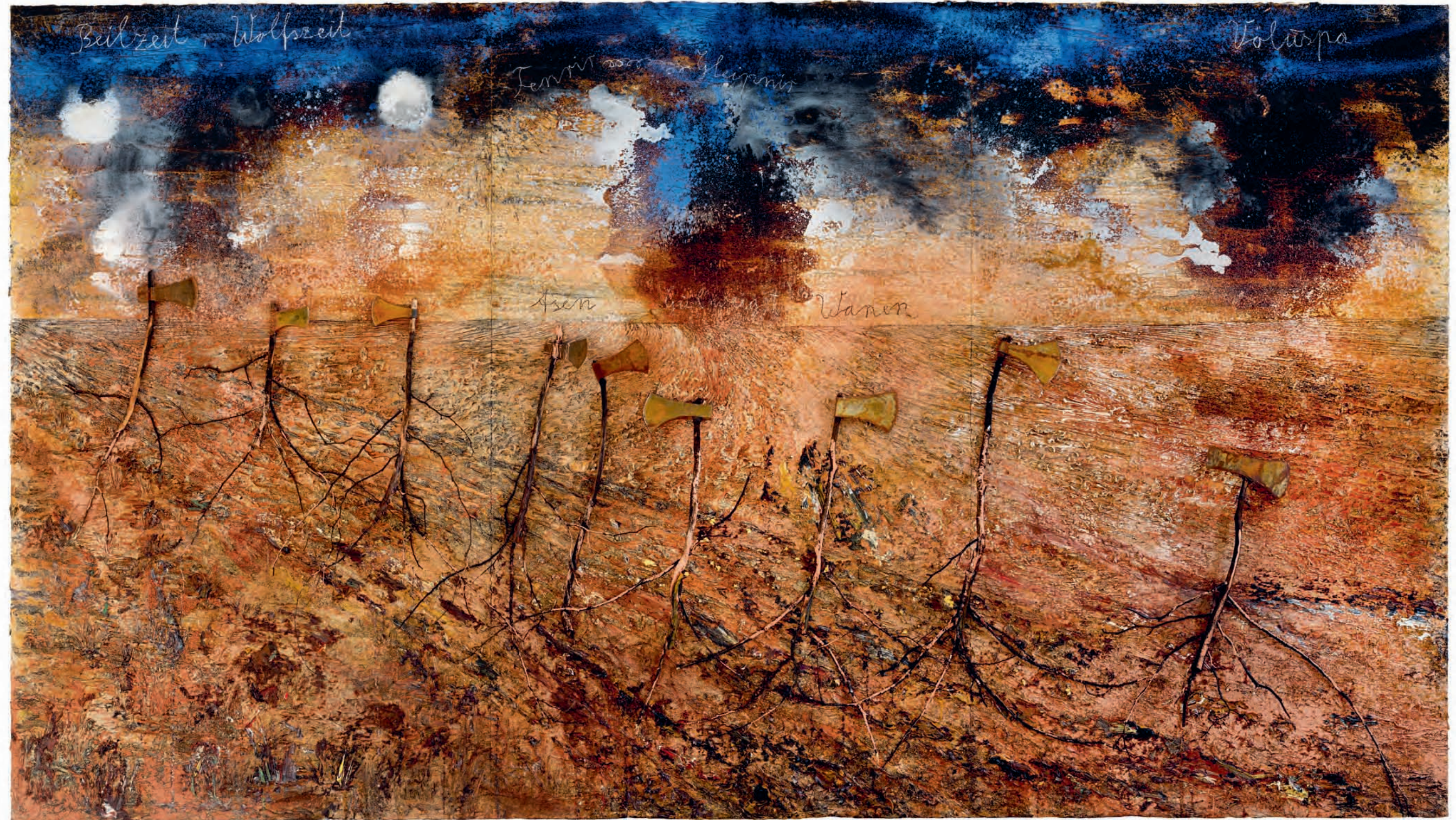
51 Anselm Kiefer Beilzeit - Wolfszeit (Bijtijd - Wolfstijd) , 2019 Emulsie, olieverf, acrylverf, schellak, hout en metaal op doek, 470 x 840 cm Collectie van de kunstenaar