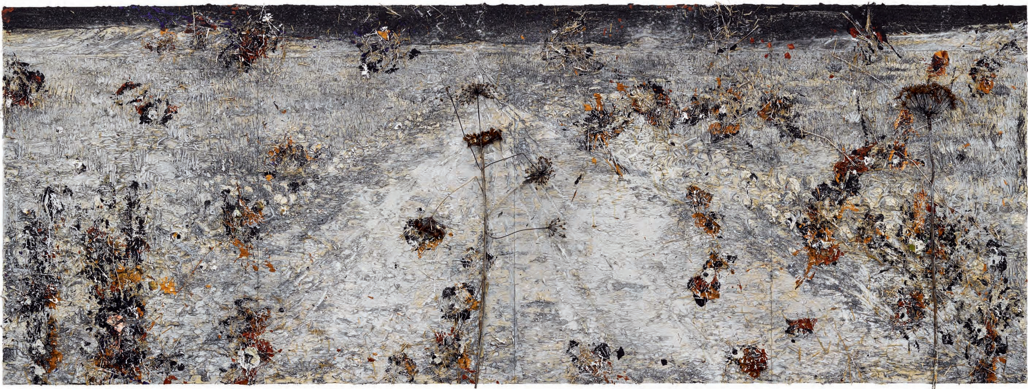
61 Anselm Kiefer Schierlingsbecher (Scheerlingbeker) , 2019 Emulsie, olieverf, acrylverf, schellak, staal, hout, lijm, stro en gedroogde planten op doek, 280 x 760 cm Collectie van de kunstenaar