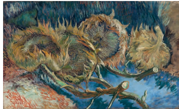
35 Vincent van Gogh Vier uitgebloeide zonnebloemen, 1887 Olieverf op doek, 59,5 × 99,5 cm Kröller-Müller Museum, Otterlo

Misschien is er één uitzondering. In augustus 1998 schrijft Kiefer in zijn aantekenboek: ‘een aquarel voltooid: zonnebloemen op een tafel’. Maar dan overvalt hem als altijd de twijfel over wat dit is en wat hij nu eigenlijk heeft gemaakt: ‘wat doe je met de zonnebloemen op een tafel als het geen stilleven is? want dit is geen stilleven, de zonnebloemen staan niet in een vaas en ze liggen niet op de tafel. ze staan ondersteboven in de grond, groeien verder in de grond op de tafel. en dus? zonnebloemen die op een tafel groeien, dat betekent allereerst dat ze pas halverwege beginnen. ze groeien niet vanaf de grond, maar vanaf ergens daartussen. je zou kunnen zeggen dat ze al boven-